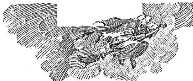
Table des matières du " Diable en Belgique " Roberto J. PAYRO (ou Payró ) : IEA3637 PARTIE 1 (pages I-37 : "LE DIABLE ARCHITECTE", "UNE CREATURE D'APOCALYPSE" (LE "VERT-BOUC"), "LE PACTE AVEC LE DIABLE", "LE STRATAGEME DE SAINT-REMACLE", "LE TILLEUL DES PENDUS" et "LE SORCIER DU CONDROZ".) :